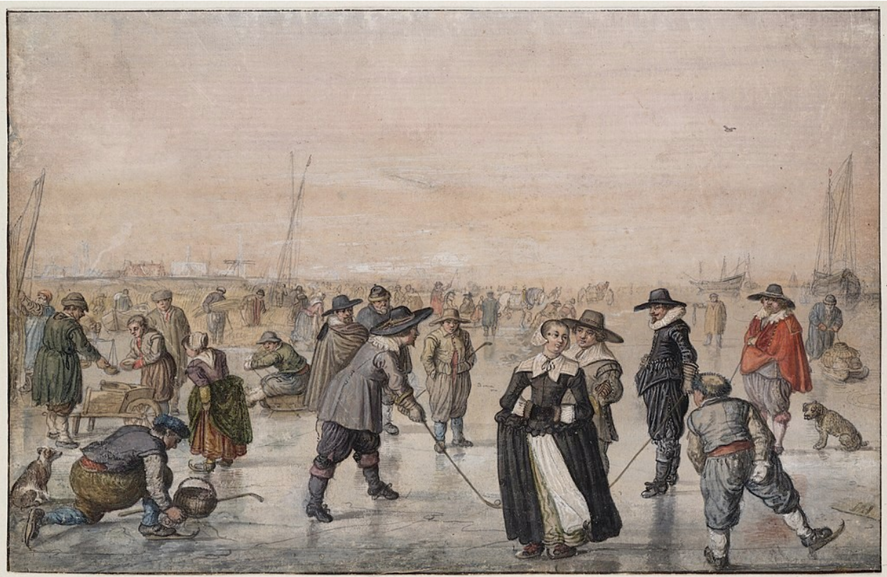
Ijsvermaak, geschilderd in 1608 door Hendrick Avercamp