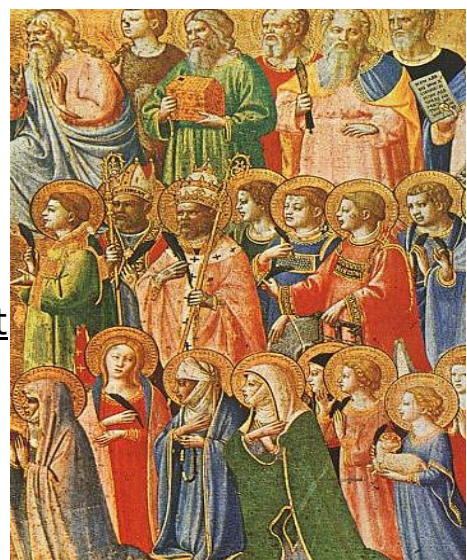
Allerheiligen, schilderij door Fra Angelico.

Eerste Allerheiligen ( Sollemnitas Omnium Sanctorum in het Latijn ) is een christelijk feest ter nagedachtenis aan alle heiligen en martelaren . Het is een jaarlijkse feestdag, die door Rooms-katholieken en anglicanen op 1 november gevierd wordt. In de Rooms-Katholieke Kerk is het een hoogfeest . In de